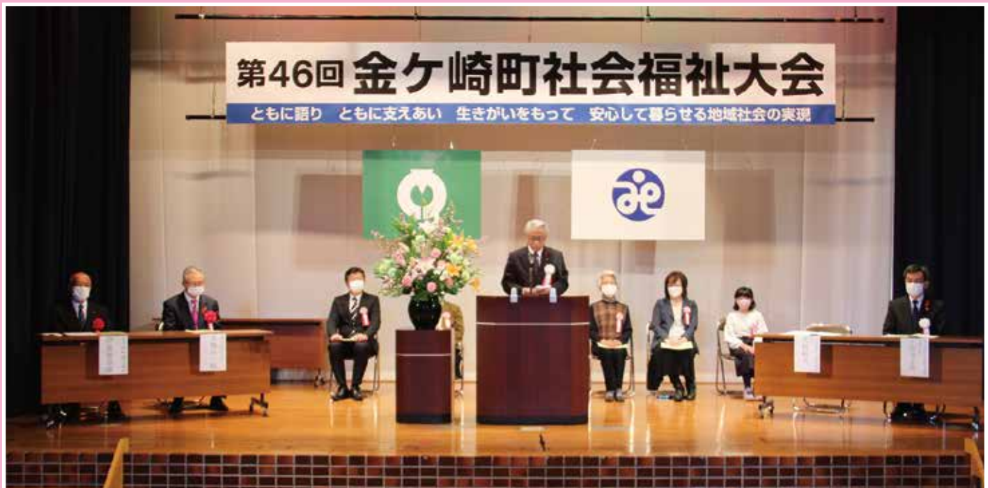
第46回 金ヶ崎町社会福祉大会

共同募金は、住み慣れた地域で、誰もが安心して暮らせる地域づくりを応援しています。金ヶ崎町社会福祉協議会では、ゆいっこハウスや配食サービス、ひとり親家庭交流事業などの地域福祉活動事業に、町民のみなさんや企業の方々からお寄せいただいた募金を活用しております。