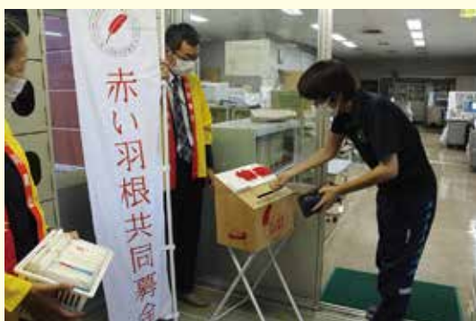
金ケ崎町保健福祉センター