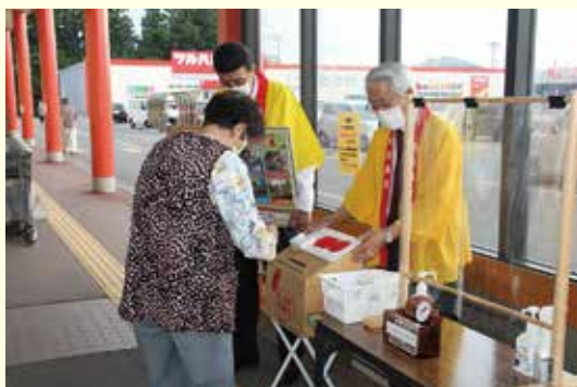
ビッグハウス金ケ崎店

10月1日～5日のうちの3日間、町内4ヵ所で街頭募金を行いました。新型コロナウイルス感染拡大の状況を鑑み、規模を縮小して実施しました。