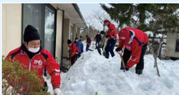
〈この事業には赤い羽根共同募金が使われています。〉