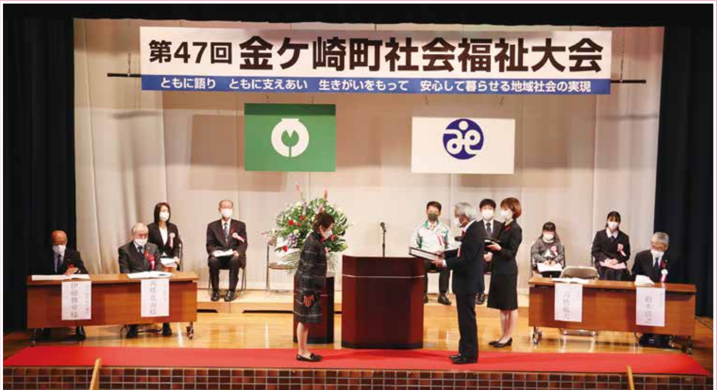
第47回 金ヶ崎町社会福祉大会