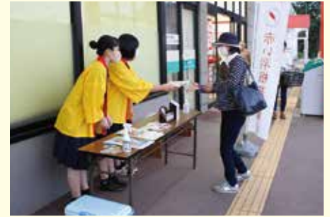
ビッグハウス金ケ崎店