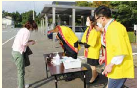
金ケ崎町保健福祉センター