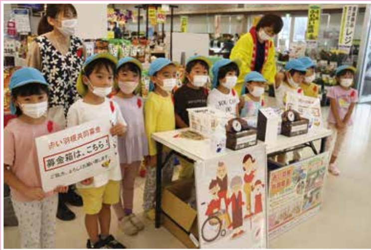
街頭募金 イオンスーパーセンター金ヶ崎店