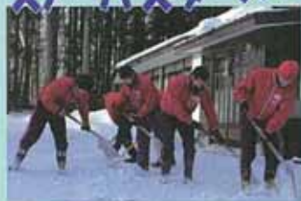
～昨年度の様子～ トヨタ自動車東日本野球部の皆さん

今年度も金ケ崎町スノーバスターズが12月20日に出発しました。スノーバスターズは個人や団体のボランティア協力をいただきながら、ひとり暮らし等の高齢の方や障がいのある方の世帯に対して行う除雪支援活動です。