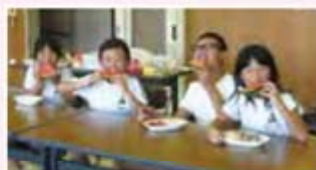
おいしくいただきました!!