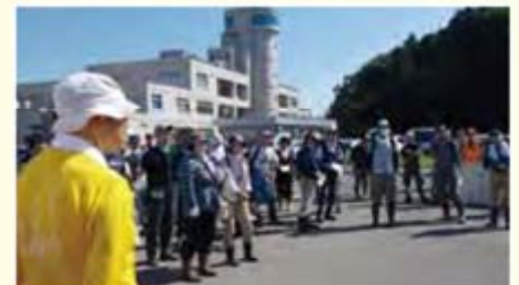
朝のミーティング

最後になりましたが4日間という短い期間ではありましたが、全国の社会福祉協議会職員やボランティアのみなさまからご支援ご協力を賜りましたことに対しましてこの場を借りて感謝と御礼を申し上げます。