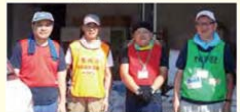
秋田・岩手チームの資材班