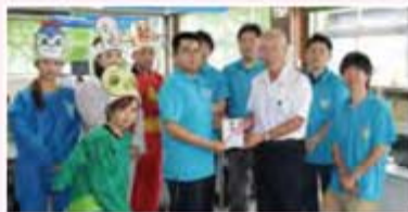
むかでマラソンの賞金から寄付されました。