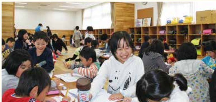
▲金ケ崎学童保育所での様子

また、学童保育所の利用料については、平成29年度で引き下げを実施したところですが、今年度から新たに減免制度を導入し、ひとり親世帯や2人以上の児童が利用する世帯の負担軽減を図ることにより、子育て支援につなげていくものとしします。