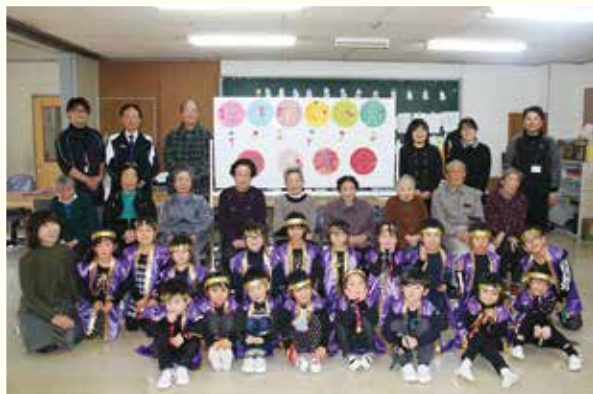
▲Aサービス事業所・三ヶ尻幼稚園交流会

心身機能の低下を予防し充実した生活を送れるように、機能訓練、レクリエーション、創作活動などに取り組む事業で、毎週火曜日に開所しています。