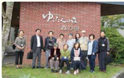
介護者リフレッシュ