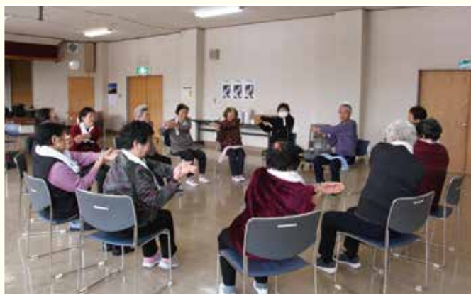
▲体操ショッピングバスでは健康づくりをしながら参加者同士の交流や買い物が楽しめます。

買い物支援バス、体操ショッピングバスなど外出支援・介護予防を目的としたバス事業は利用者からもご好評いただき、参加者も増加しております。また、昨年度から開始した工場見学バスは男性参加者の拡大にもつながるため、今後もニーズを踏まえながら事業展開していくものとします。