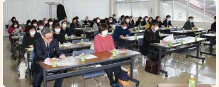
▲福祉センター大会議室▲