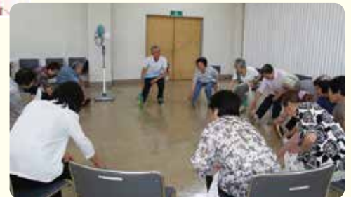
体操ショッピングバス