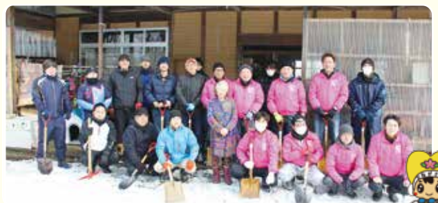
スノーバスターズ