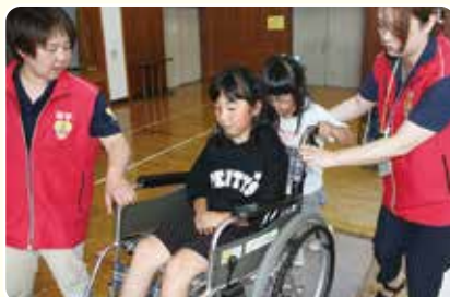
ボランティアスクール

令和元年度の事業運営方針及び事業計画の詳細については、金ケ崎町社会福祉協議会のホームページに掲載しております。