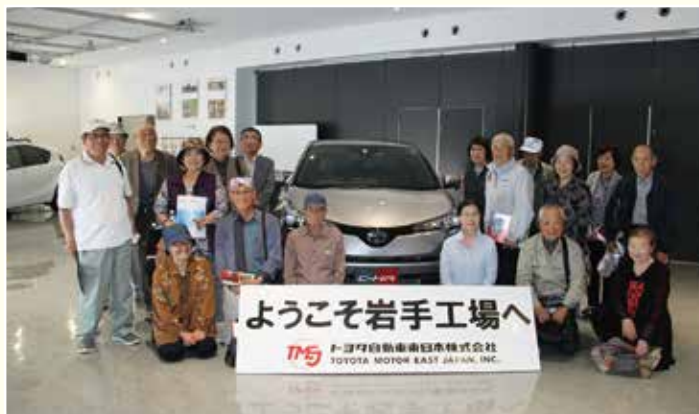
▲工場見学バスは男性のみさんから ご好評いただいています。