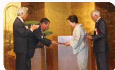
▲褒賞状・記念品贈呈