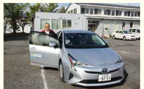
▲トヨタカローラ南岩手(株) (配食サービス事業)