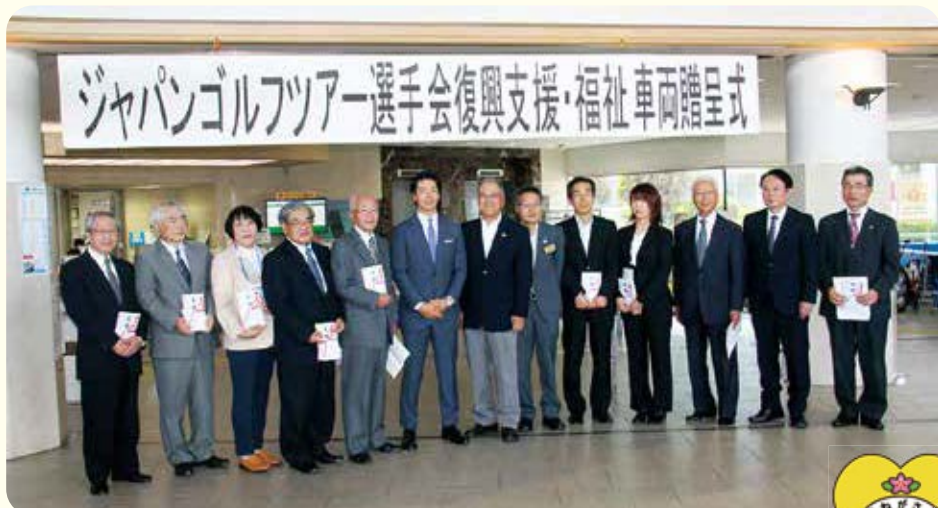
◀車にサインする石川会長