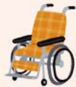
♥ 優しい言葉をかけながら車イス体験