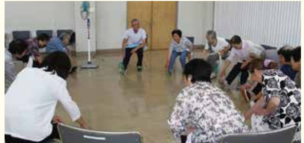
体操ショッピングバス事業