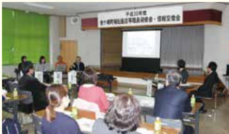
▲町内福祉施設等研修会・情報交換会を開催

町の指定管理者制度に基づき、金ケ崎学童保育所、北部学童保育所、三ヶ尻学童保育所及びグループリビング「壮健ホーム」の施設管理を行いました。