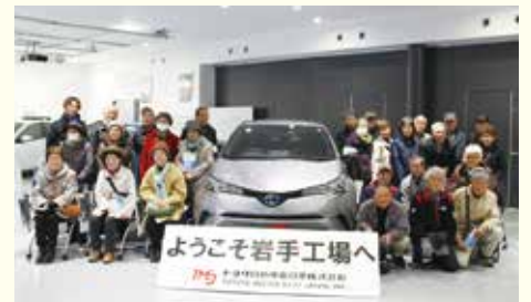
▲「シニア工場見学バスツアー」の実施