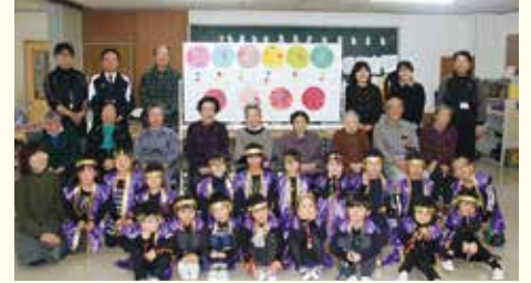
▲通所型Aサービス事業所 (三ヶ尻幼稚園との交流会)