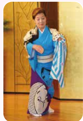
▲祝舞 (南部千代連社中) ▶