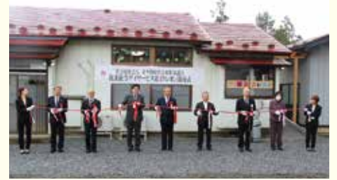
▲放課後等デイサービス第3クレヨン開所