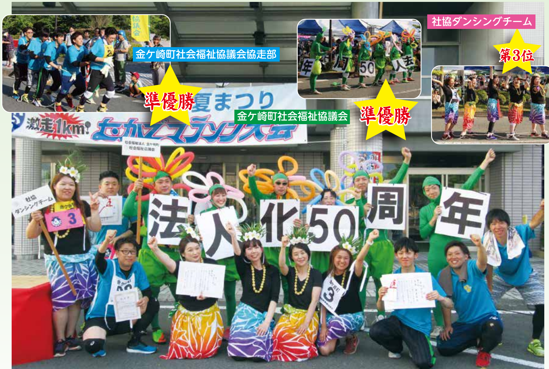
金ヶ崎町社会福祉協議会協走部