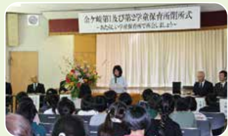
金ヶ崎学童保育所