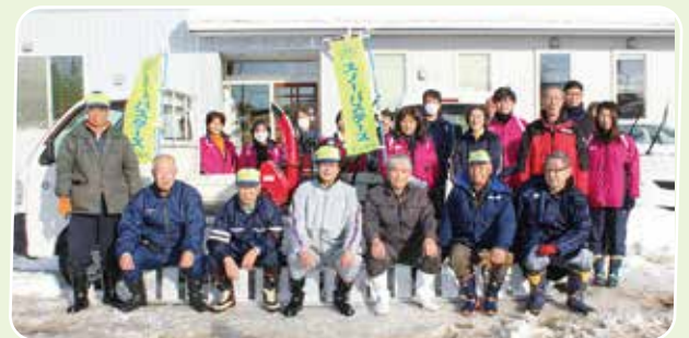
スノーバスターズ