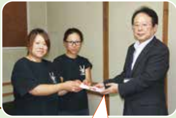
金ヶ崎夏まつりむかでマラソンの賞金の一部を寄附して頂きました。