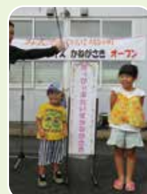
はっぴいぶれいすかねがさき