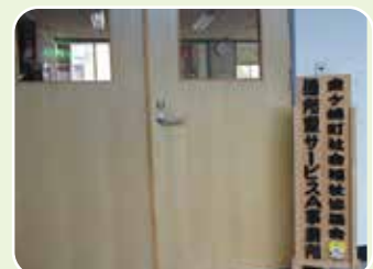
通所型サービス A 事業所