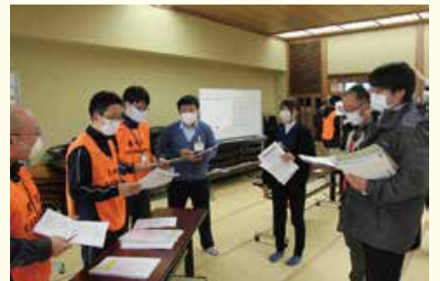
▲災害ボランティアセンター設置運営訓練