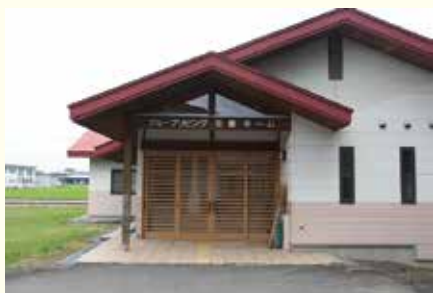
グループリビング 壮健ホーム▶