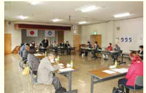
▲金ケ崎町地域福祉活動計画委員会