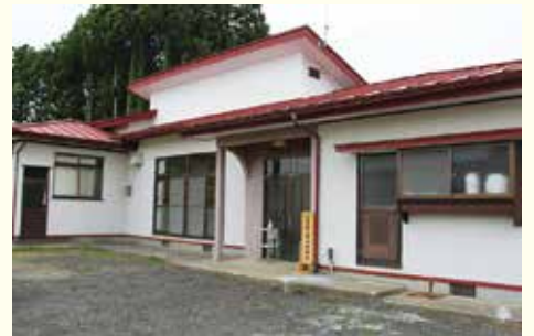
▲北部第2学童保育所