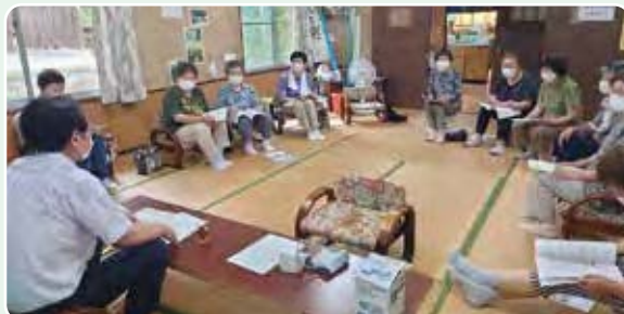
▲すずらんグループ