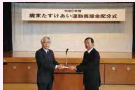
▲歳末義援金配分式