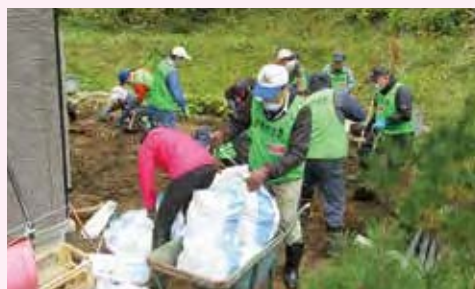
▲県内の災害ボランティア