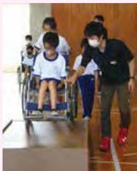
▲ボランティアスクール