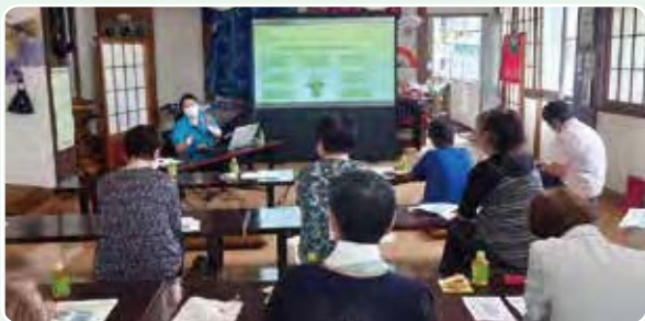
▲かみしも結いの会