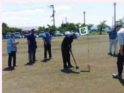
▲南方自治会連合会 (グランドゴルフ)