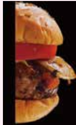
Life BASE バーガー 800円 (税込)

去年の9月にオープンした「シェア店舗」のLife BASEからは、1年の感謝の気持を込め『Life BASE バーガー』が10月1日から販売されます。こちらのハンバーガーの売り上げの一部をご寄附いただけます。