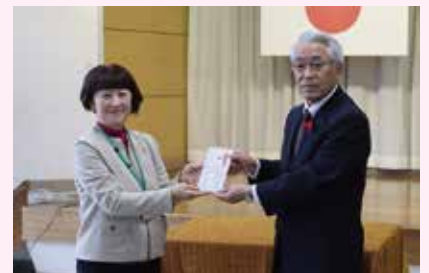
◀歳末義援金配分式