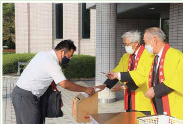
街頭募金（金ケ崎役場庁舎）