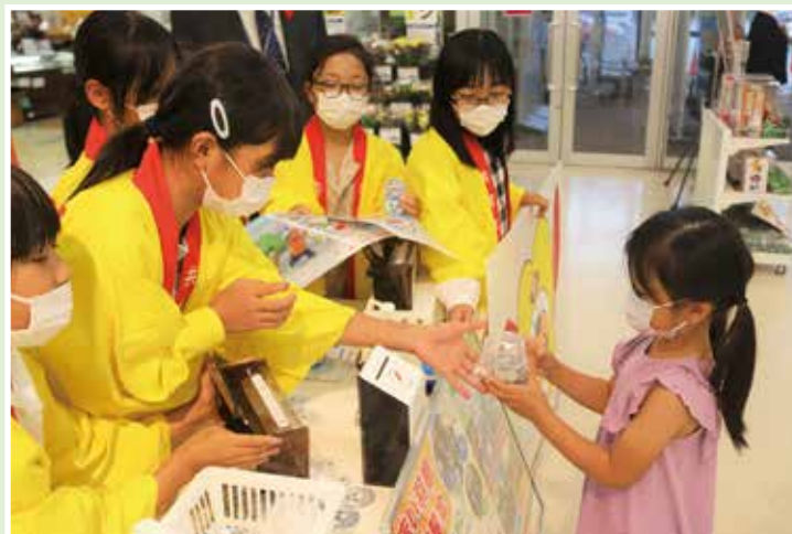
街頭募金（イオンスーパーセンター金ケ崎店）