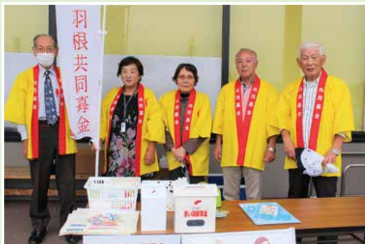
街頭募金（アークス金ケ崎店）

今年も、10月1日から赤い羽根共同募金運動を展開します。 赤い羽根共同募金は、安全で安心して暮らすことができる地域づくりに役立てられます。 町民のみなさまの思いやりが、住みやすい町づくりの原動力になっています。