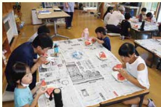
上平沢自治会の皆さんと楽しいおやつ時間

北部学童保育所で8月8日、地域交流会を開催しました。児童に加えて上平沢自治会と町子育て支援課あわせて約40名の皆さまに