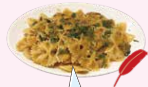
鶏肉ときのこの トマトクリーム パスタ 980円 (税別)

羽ばたく蝶のような形の pasta 「ファルファッレ」を使用した濃厚な味わいの当メニューは、共同募金のロゴでもある「羽根」から着想を得てシェフが考案した自信作です。