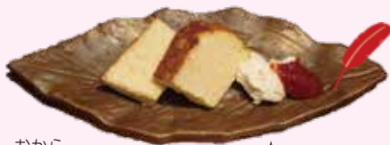
おから チーズケーキ 360円 (税込)

おからを使っているの、とてもヘルシーな仕上がりとなっております。黒い粒は、大豆の胚芽なので、栄養満点です。