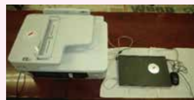
▲町上自治会 (パソコン、プリンター)