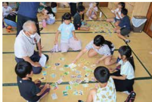
カルタ遊びを通じた交流風景

参加いただき、子どもたちとカルタ遊びをしたり、スイカを食べたりして親睦を深めました。