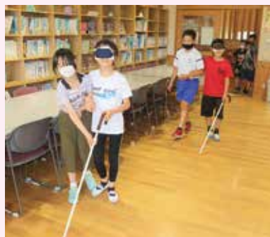
◀ボランティアスクール