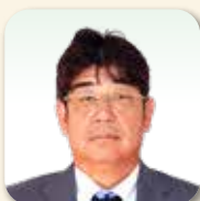
じ どうしゃひがしにほん トヨタ自動車東日本(株) いわ て こうじょう 岩手工場 様