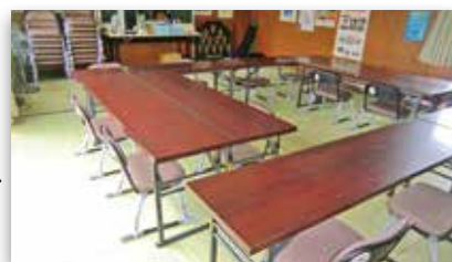
野崎講中自治会 (会議テーブル、座敷チェア)

【岩手県共同募金会福祉のまちづくり支援事業】 http://www.akaihane-iwate.or.jp/jyosei/fukushi.html