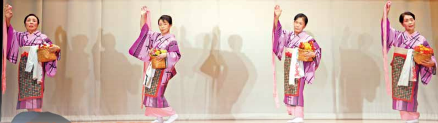
英千枝会の皆さまによる「紅花幕情」