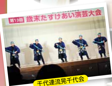
千代連流晃千代会