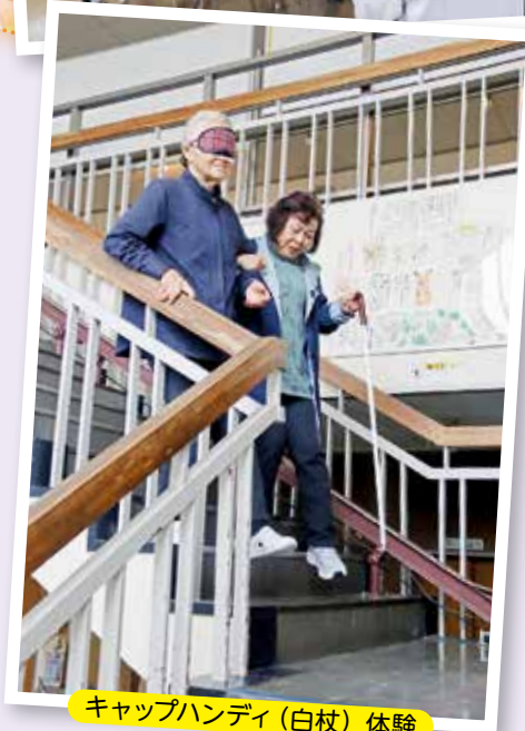
キャップハンディ（白杖）体験

11月25日、福祉センターを会場に、ボランティアに興味・関心がある、活動の幅を広げたいと考えている方々を対象にして「はじめてのボランティア講座」を開催しました。この講座は金ケ崎町ボランティア連絡協議会が昨年度から開催しているもので、当日は15名の町民の皆さまにご参加いただきました。当日は朗読ボランティア団体たんぽぽの皆さまから録音実演を交えながら活動について説明いただいたほか、各種ボランティア活動について説明を行いました。また、ボランティア見学やキャップハンディ体験等をとおして、ボランティア活動に関する理解を深めました。参加者からは「体験は理屈以上、良い体験でした」、「ボランティアの方々がいきいきと活動している姿を見て感動した」などの感想をいただきました。